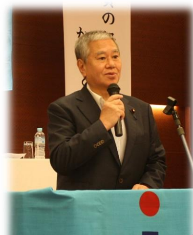
原口一博衆議院議員