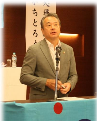
武藤国公連合中央執行委員長

大会当日、私たち税関労組のために、激励にかけつけていただきました来賓を紹介します。大変お忙しい中、暖かい言葉をいただきました。ありがとうございます。