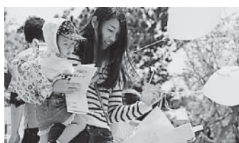
京築・田川メーデー