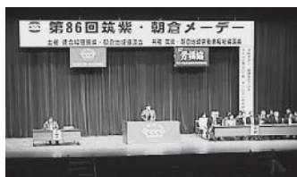
筑紫・朝倉メーデー