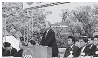
福岡中央メーデー 会長あいさつ