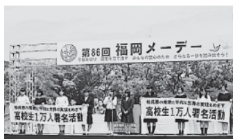
福岡中央メーデー