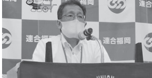
福岡県の取り組みを説明される牧草企画広報監

マジックショーの時間では、例えばプラスチックストローの環境に与える影響について伝えるために、大きなストローを小さな紙袋から出すマジックや、資源を大切にというメッセージを込めて、牛乳パックをリサイクルしてトイレットペーパーに瞬時に変えるマジックなども披露いただきました。