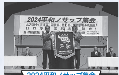
2024平和ノサップ集会