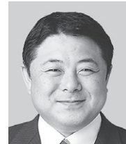
山本 耕一 ホームページ