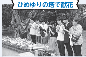
ひめゆりの塔で献花