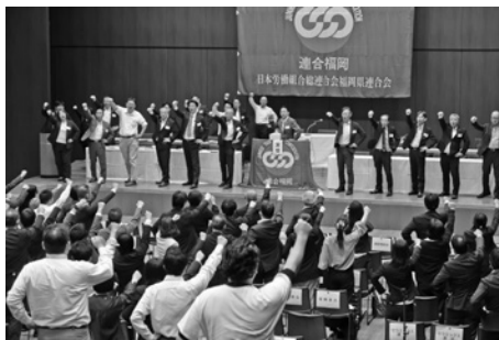
会場全体でのガンパロー三唱