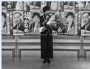
比例当選を決めた堤衆議院議員と許斐衆議院議員