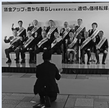
官民労各代表(13団体)