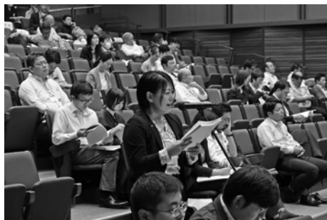
質問をする吉田春奈代議員(JR連合)