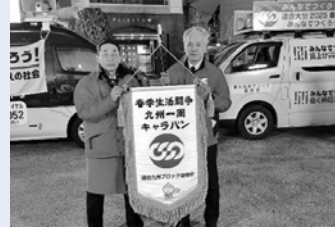
連合大分へ春闘フラッグ引継ぎ

連合福岡は、2月5日に連合佐賀から春闘フラッグを引き継ぎ、10日連合大分に日田市で行われる引継式で春闘フラッグを引き渡しました。福岡行動の期間中は、地域協議会と連携して各地で春闘開始宣言集会や街頭集会を行いながら、街宣を展開しました。