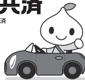
公式キャラクタービットくん

【こくみん共済】は堅利を目的とし、不安の軽減として共済事業を営み、相互扶助の精神にもとづき、組合員の皆さまの安心とゆとりある暮らしに貢献することを目的としています。この趣旨に賛同いただき、出資金を払い込んで居住地または勤務地の共済生活の組合員となることで各種共済制度をご利用いただけます。