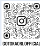
後藤県議 インスタグラム GOTOKAORI.OFFICIAL