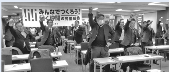
福岡の会場からWEB参加の様子

2025 春季生活闘争の開始を広く社会に向けて宣言し、構成組織・組合員が一丸となって闘いに取り組む意志を固めることを目的に集会を開催しました。「みんなで作ろう!賃上げがあたりまえの社会」というスローガンを掲げ、新たなステージを定着させるとの決意のもと力強く運動を推し進める地方連合を代表して決意表明をしました。