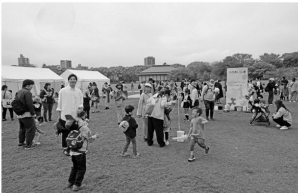
写真は昨年のように

構成組織・単組のみなさまは、会場へアクセス方法など福岡地域協議会からの参加案内をご確認の上、ご来場ください。県内その他の会場についての詳細は次月号で掲載いたします。