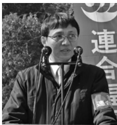
取り組み報告 尾塚委員長 (JAM日本タングステン労組)