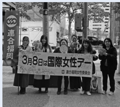
女性委員会による街頭・周知行動