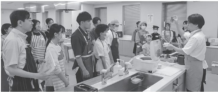
講師からの説明を聞く参加者

献立 簡単!コロコロミートボール ツナと油揚げの炊き込みご飯 きゅうりの胡麻ポン酢和え 出汁いらす!きのこ玉ねぎの味噌汁