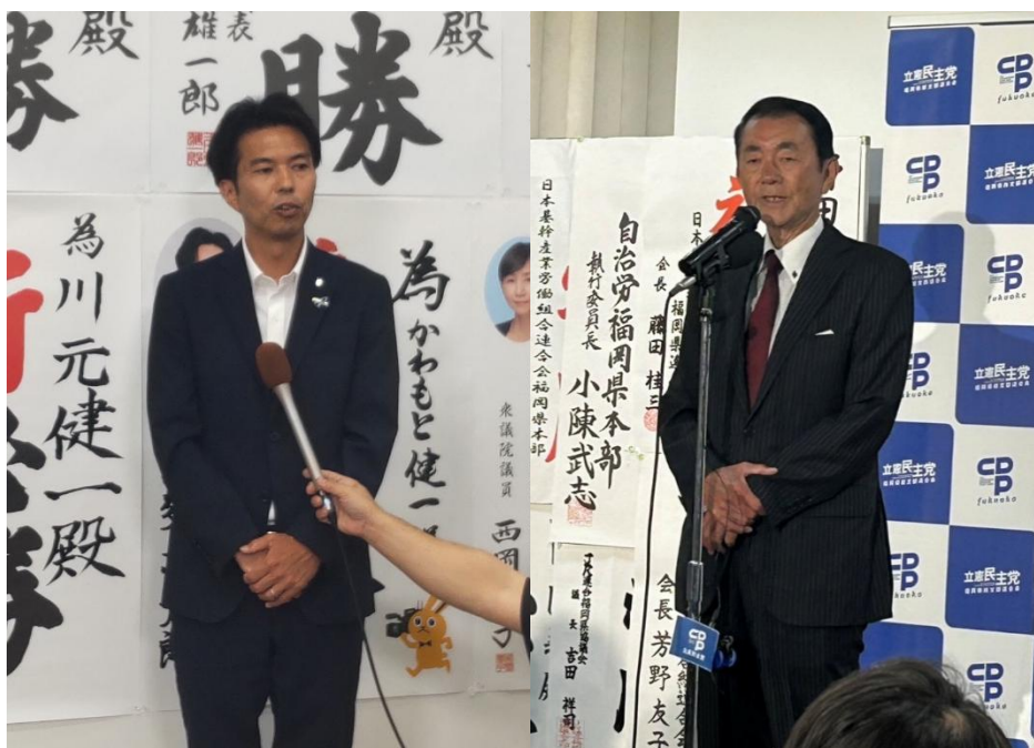
支援者に感謝の言葉を述べる両候補者