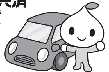
公式キャラクター ピットくん