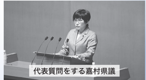
代表質問をする嘉村県議